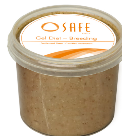
SAFE® gel diet breeding

Pour les périodes de stress: animaux affaiblis, postopératoire, transport, élevage, ... A utiliser dans le cadre de protocoles expérimentaux. Peut être distribué en complément de l'eau et de l'aliment. Source d'eau et d'aliment très appétente et très digestible.