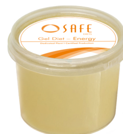
SAFE® gel diet energy