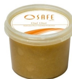
SAFE® gel diet high fat