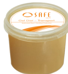
SAFE® gel diet transport