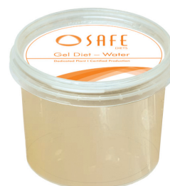
SAFE® gel diet water

Pour les périodes de stress: animaux affaiblis, postopératoire, transport, élevage, ... A utiliser dans le cadre de protocoles expérimentaux. Peut être distribué en complément de l'eau.