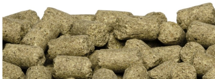
SAFE ® 107