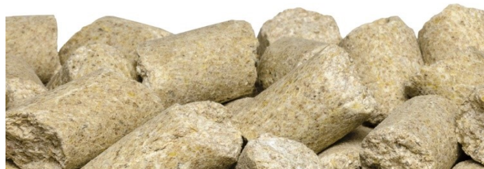
SAFE ® D04