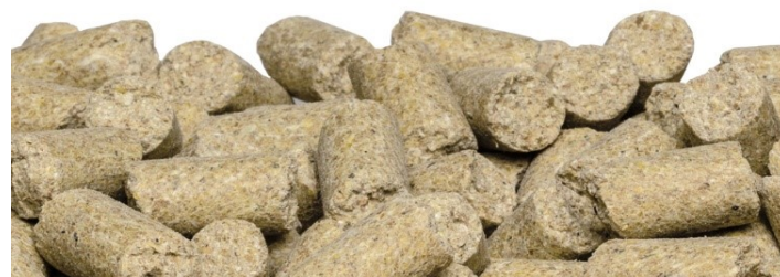
SAFE ® D113

ALIMENT CONDITIONNEMENT STANDARD SAFE ® D113 1 x 10 kg Sac papier autoclavable