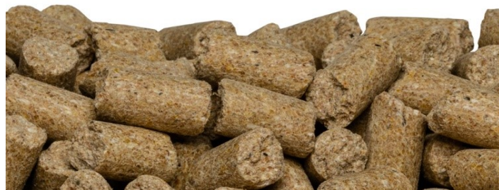
SAFE ® D132

SAFE ® D132 1 x 10 kg Sac papier autoclavable