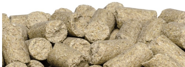
SAFE ® D30