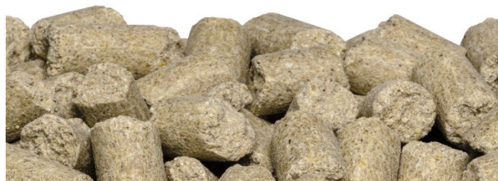
SAFE ® D40