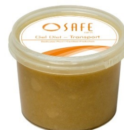
SAFE ® gel diet transport

Pour les périodes de stress: animaux affaiblis, postopératoire, transport, élevage, ... A utiliser dans le cadre de protocoles expérimentaux. Peut être distribué en complément de l'eau et de l'aliment. Source d'eau et d'aliment très appétente et très digestible.